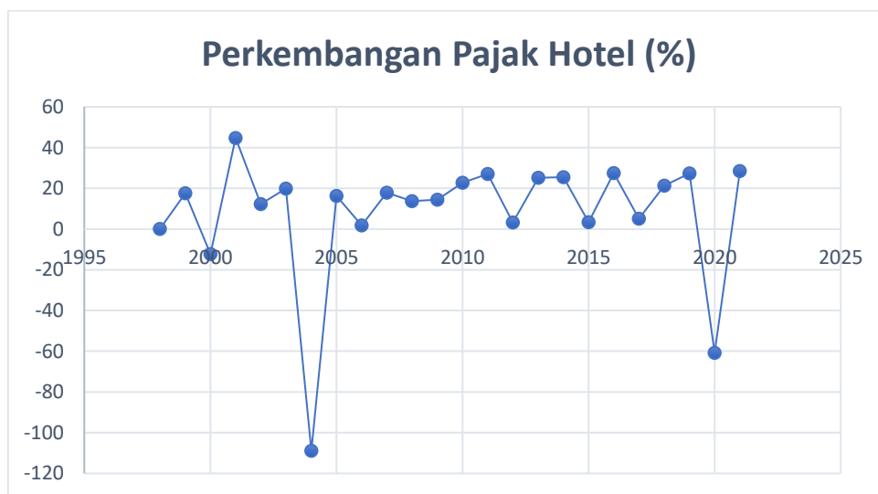
Gambar 1. Perkembangan Pajak Hotel di Kota Jambi Tahun 1998 – 2021

Layanan yang disediakan oleh hotel dikenakan pajak yang disebut sebagai pajak hotel. Layanan yang ditawarkan hotel dengan biaya tertentu, yang dapat mencakup layanan tambahan sebagai bagian dari keseluruhan misi hotel untuk memberikan kemudahan dan kenyamanan, termasuk fasilitas – fasilitas tambahan.