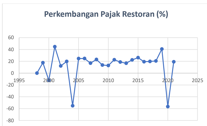
Gambar 2. Perkembangan Pajak Restoran di Kota Jambi Tahun 1998 – 2021

Pajak Restoran adalah pajak yang dipungut atas pelayanan restoran. Restoran, kafetaria, kantin, warung, bar, dan sejenisnya, serta jasa boga, merupakan contoh fasilitas yang menyediakan makanan dan/atau minuman dengan dipungut bayaran. Adapun persentase perkembangan pajak hotel di Kota Jambi adalah sebagai berikut: