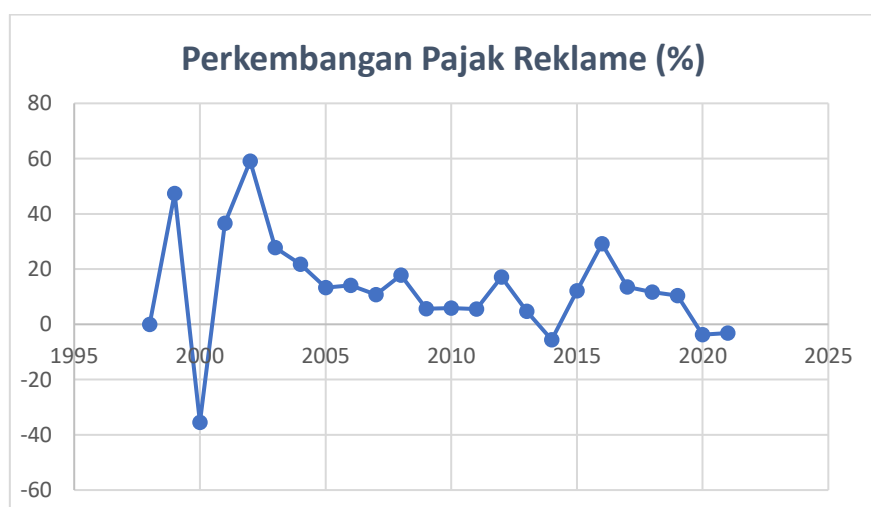
Gambar 4 Perkembangan Pajak Reklame di Kota Jambi Tahun 1998 – 2021

Reklame didefinisikan sebagai alat, benda, perbuatan, atau media yang bentuk dan corak ragamnya dirancang untuk memperkenalkan, menganjurkan, mempromosikan, atau menarik perhatian umum terhadap barang, jasa, orang, atau badan yang dapat dilihat dari suatu tempat oleh umum, menurut Pasal 1 angka 27 UU PDRD. Berikut Perkembangan pajak reklame di Kota Jambi tahun 1998 – 2021.